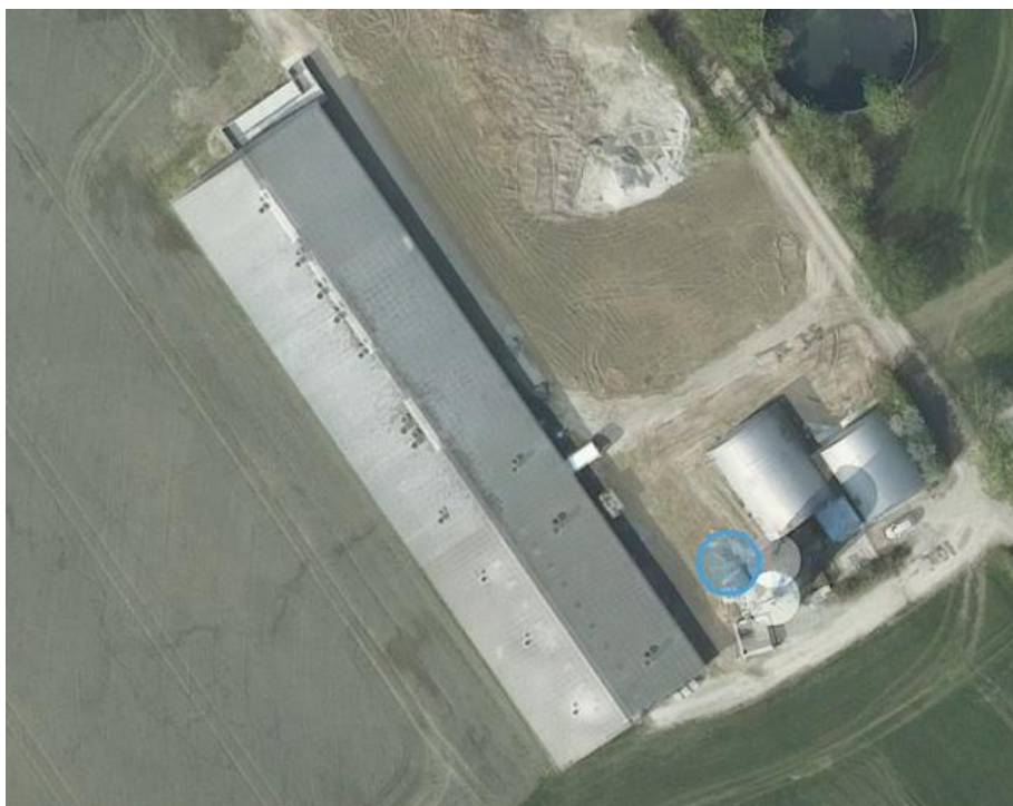
Figur 1: Oversigtskort over anlægget på Egeskovvej 6A. Den blå cirkel angiver placeringen af ny silo

Der ønskes at opstille en kornsilo i tilknytning til staldanlægget på ejendommen (jf. figur 1). Siloen er i galvaniseret stål med en totalhøjde på 13,4 m (jf. figur 2).